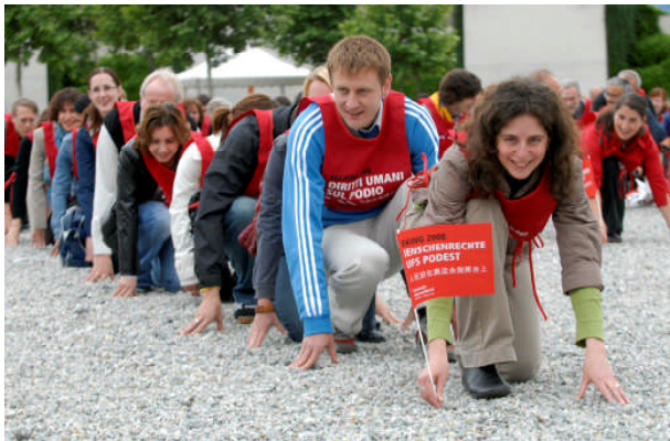
Olympiades de la section suisse

Cette activité peut s'organiser en collaboration avec les professeurs d'éducation physique, de français et de théâtre (surtout concernant l'équipe d'animation).