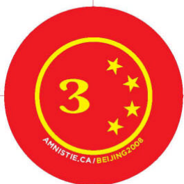
Médailles pour les Olympiades