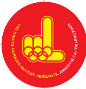
Macaron de la campagne

Dans plusieurs régions du Québec, des activités sportives sont organisées par des clubs de sports ou autre organisation. Pensez au Tour de l'Île de Montréal , à celui de l'Île d'Orléans , au Défi métropolitain qui part de