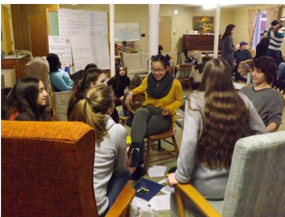
Jeu Esperanza : réalise ton pacte des droits humains — Février 2016.

Pour inscrire vos jeunes : formulaire d'inscription rose « Formation des jeunes »