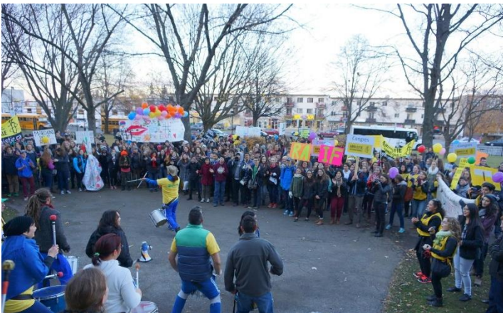
Clôture du Congrès 2015 en musique avec Zuruba !