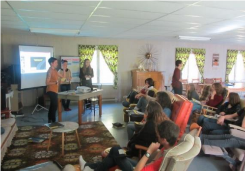
Atelier « Sympathique cours de droits humains 101 » — Formation 2012