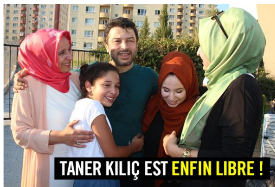
Taner Kiliç, Président d'Amnistie internationale Turquie ( cas 2017 ) a été libéré le 15 août 2018 après avoir passé plus d'un an en prison.