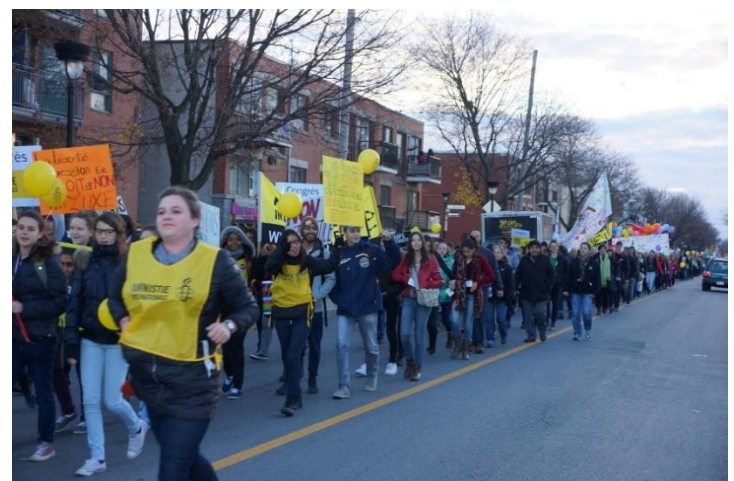
Marche de solidarité pour la liberté d'expression — Congrès 2015.

Pour plus d'informations sur nos événements :