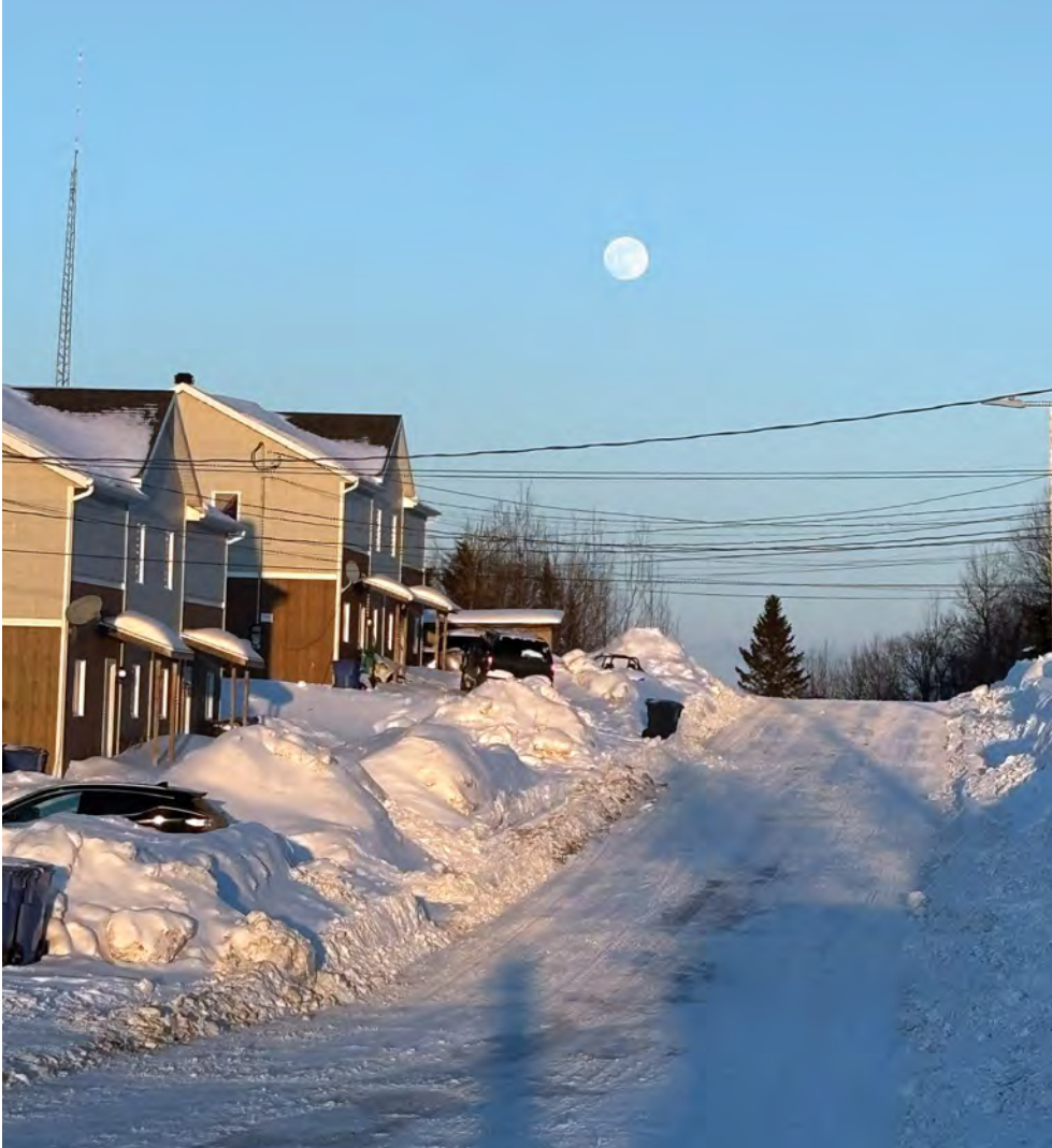
Rue de Manawan

Amnistie internationale estime que le racisme systémique à l'égard des Peuples autochtones au Québec et au Canada, les répercussions persistantes des politiques coloniales et le sous-financement historique des réserves sont des facteurs clés qui contribuent à la crise du logement à Manawan. La situation requiert que l'on prenne des mesures immédiates et significatives pour que les Premières Nations vivent dans la dignité, cessent d'être marginalisées et discriminées, et se développent conformément à leurs priorités et leurs objectifs. Puisque le gouvernement fédéral reconnaît le racisme systémique vécu par les Autochtones et ses conséquences sur leur vie quotidienne, il doit mettre en œuvre un plan pour répondre adéquatement à tous leurs besoins fondamentaux en matière de logement et d'infrastructures afin que tous et toutes vivent dans la dignité. Les provinces, notamment le Québec, doivent reconnaître l'existence de racisme systémique envers les Autochtones et travailler main dans la main avec les communautés sans se buter aux compétences de juridiction.