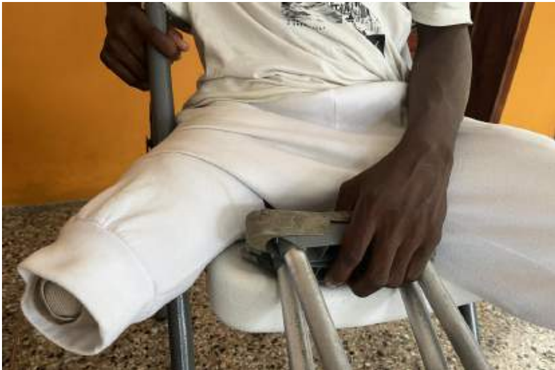
Un garçon de 16 ans, dont la jambe a été amputée en janvier 2024 après qu'un membre d'un gang lui a tiré dessus, avait reçu des béquilles d'une ONG internationale, mais au moment de l'entretien avec Amnesty International en septembre, les béquilles étaient déjà en mauvais état, et il ne pouvait pas s'en procurer de nouvelles.

Le garçon a ajouté qu'auparavant, il utilisait ses jambes pour fabriquer des râpes de cuisine, que sa mère vendait ensuite pour subvenir aux besoins de la famille. Il a expliqué qu'il se servait de son pied pour façonner le métal, un geste qu'il ne peut plus faire, tout comme s'asseoir comme avant pour faire ce type de travail.