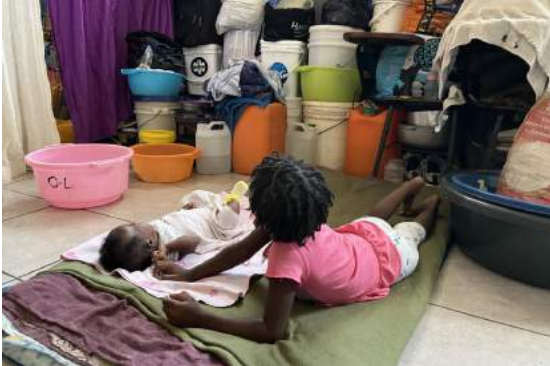
D'après l'ONU, Haïti est le théâtre de l'une des pires crises de la famine dans le monde : 5,4 millions de personnes souffrent de faim aiguë. De nombreux enfants risquent de souffrir de malnutrition aiguë voire de mourir de faim.

Ce rapport d'Amnesty International vise à offrir un espace pour l'expression de la voix des enfants, indispensable pour comprendre l'impact des violations des droits humains et des atteintes à ces derniers sur leurs droits et besoins de manière plus générale, ainsi qu'à contribuer à mettre en lumière les obstacles à la réinsertion et à l'avenir.