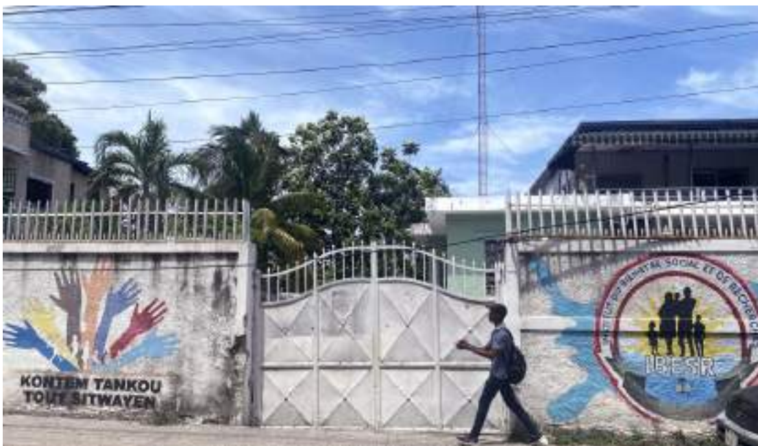
Amnesty International s'est rendue au Centre de rééducation des mineurs en conflit avec la loi, ou CERMICOL (photo du haut) et a constaté la surpopulation et les pratiques de détention illégales qui y sont pratiquées. Les chercheuses se sont entretenues avec des responsables de l'établissement et de l'IBESR (photo du bas), l'agence de protection de l'enfance, à propos de la réinsertion, qui est au point mort.