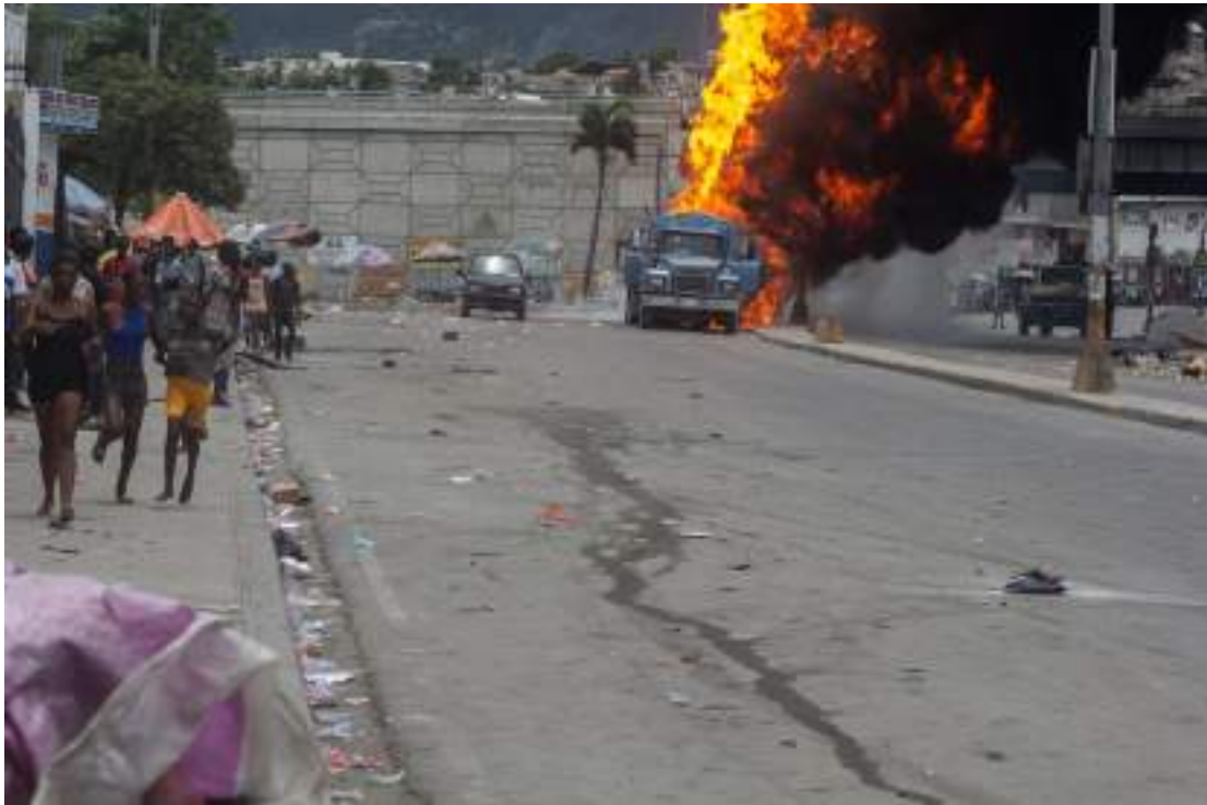
Des personnes fuyant l'explosion d'un camion-citerne transportant du carburant, causée par un tir de projectile de membres d'un gang qui tentaient de le saisir, Port-au-Prince, 4 juin 2024.

Le 18 décembre 2024, Amnesty International a écrit au bureau de Premier ministre Alix Didier Fils-Aimé, présentant un résumé de ses conclusions et demandant des informations. À la date de publication, aucune réponse n'avait été reçue.