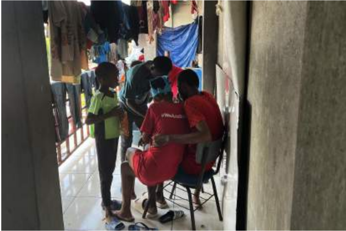
La violence des gangs constitue une offensive contre l'enfance. Elle a provoqué beaucoup de détresse et un traumatisme considérable et a entravé l'accès des enfants à l'éducation, restreint leurs déplacements et les a privés de leur droit de jouer.

De manière plus générale, le haut-commissaire des Nations unies aux droits de l'homme a recommandé aux autorités haïtiennes de « reloger immédiatement dans des installations sûres et adaptées toutes les personnes déplacées à l'intérieur du pays qui vivent actuellement dans des écoles dans des conditions sordides, conformément aux normes internationales 426 ».