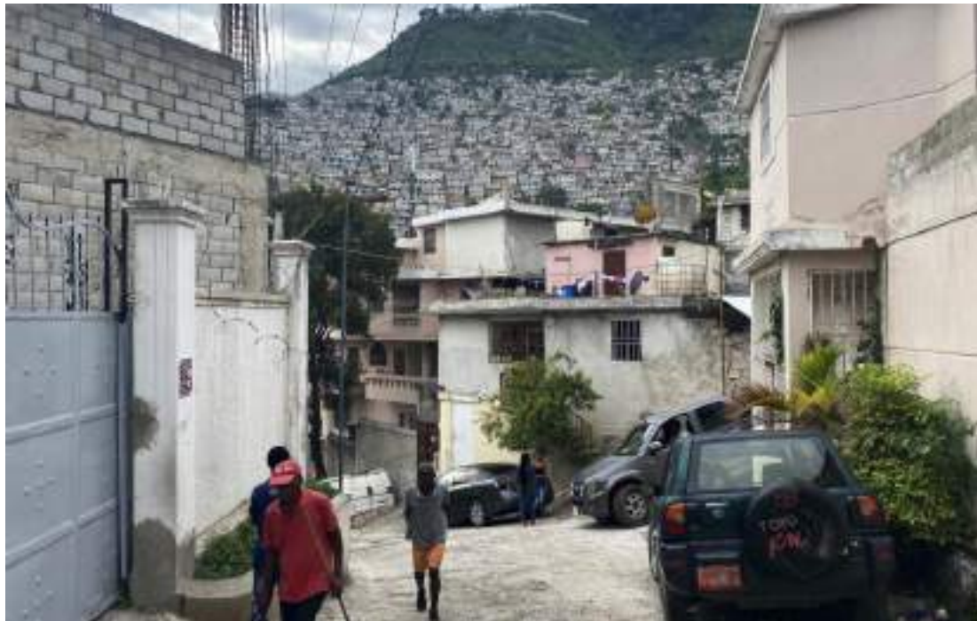
Les gangs ont intensifié leurs attaques sur la métropole de Port-au-Prince et ses environs en 2024, prenant le contrôle de nouvelles zones et renforçant leur emprise sur les populations.

Le gouvernement d'Haïti est tenu de respecter, de protéger et de concrétiser les droits prévus par ces traités. Avec le soutien de partenaires internationaux, il doit prendre des mesures concrètes de toute urgence pour protéger les enfants de toute menace actuelle et raisonnablement prévisible posée par les gangs. Les atteintes aux droits humains commises par les gangs et présentées dans ce rapport bafouent les lois haïtiennes. Il existe en outre des règles et normes internationales imposant des restrictions directes aux agissements des gangs armés, notamment la Convention sur les pires formes de travail des enfants et le Protocole de Palerme sur la traite des personnes 55 .