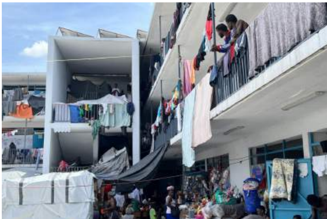
Les chercheuses d'Amnesty International ont pu constater le manque d'intimité et les conditions de surpopulation dans deux sites pour personnes déplacées dans lesquels elles se sont rendues en septembre 2024. Les pièces grandes ouvertes et les zones de douche non couvertes, ce qui est également commun dans d'autres camps d'après des travailleurs et travailleuses humanitaires, exposaient encore davantage les filles.