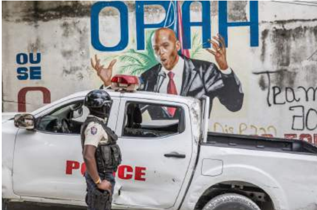
Un policier se tient près d'un mur sur lequel est peint un portrait du président haïtien Jovenel Moïse une semaine après son assassinat en juillet 2021. De nombreuses victimes de violences sexuelles ont déclaré à Amnesty International qu'elles n'avaient pas pu signaler leur agression aux autorités en raison de l'absence de forces de police dans les quartiers contrôlés par les gangs.

En septembre 2024, les autorités haïtiennes et l'ONU ont signé un protocole visant à la création de pôles judiciaires spécialisés destinés à juger les « crimes de grande ampleur, notamment les violences sexuelles et les crimes financiers 297 . » Les autorités haïtiennes doivent de toute urgence donner la priorité à la mise en œuvre du protocole et veiller à ce que les professionnel-le-s intervenant dans ces organes judiciaires soient spécialement formés pour entendre des victimes de tels crimes et à ce que les procédures soient centrées sur les victimes et tiennent compte des traumatismes. Dans le cadre de leurs efforts en vue d'assurer des procédures judiciaires efficaces et des soins pour les victimes, les autorités doivent également travailler en collaboration étroite avec des organisations haïtiennes et internationales de la société civile présentes sur le terrain et ayant été en première ligne de l'aide aux victimes et leurs familles.