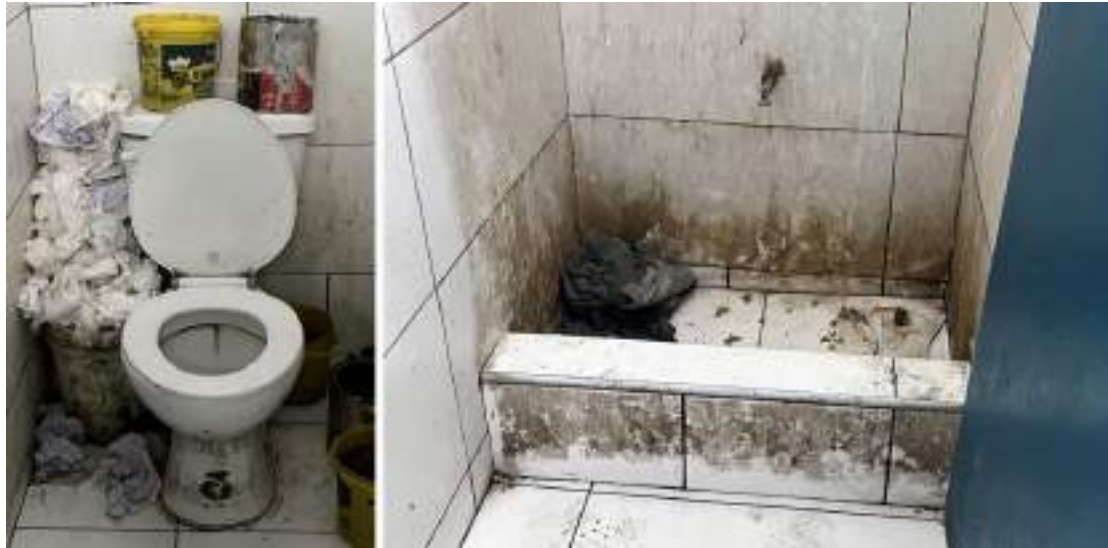
Lors de leur visite de septembre 2024, les chercheuses d'Amnesty International ont constaté que les installations sanitaires dans les sites pour personnes déplacées n'étaient pas accessibles aux personnes en situation de handicap.

Les États ont l'obligation de « prendre toutes les mesures nécessaires » pour protéger les enfants contre des effets délétères de la violence armée et de veiller à ce qu'ils « puissent bénéficier de services de santé et de protection sociale appropriés, notamment pour leur réadaptation psychosociale et leur réintégration sociale 409 ». Le gouvernement doit veiller à inclure dans sa réponse à la situation des services de santé mentale disponibles et accessibles, y compris en sollicitant une assistance technique et financière. Les donateurs et les autres acteurs humanitaires doivent contribuer au renforcement des systèmes de santé mentale. L'offre de services de santé mentale ne doit pas s'amenuiser après la phase d'urgence : il est essentiel de créer des systèmes de soins durables 410 .