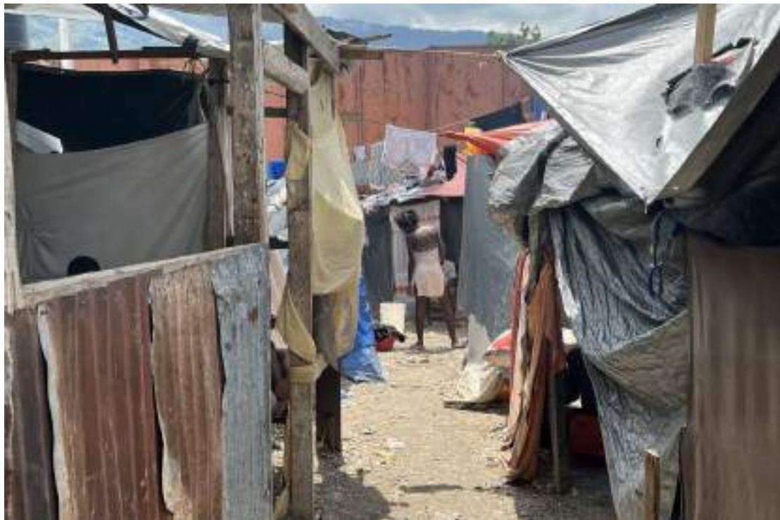
Le déplacement massif expose depuis longtemps les femmes et les filles à un risque accru de violences sexuelles en Haïti. D'après l'ONU, les multiples vagues de déplacement en 2024 ont causé des niveaux « sans précédent » de violences de ce type.

La majorité des filles qui ont été violées ont déclaré qu'elles n'avaient pas pu identifier les gangs auxquels leurs agresseurs appartenaient. Certaines filles ont été agressées par des membres de gangs qui les avaient forcées à les fréquenter ou ont été contraintes à une « relation » d'exploitation ou au commerce du sexe par des membres de gangs qu'elles connaissaient ou qu'elles avaient rencontrés. D'autres savaient quel gang contrôlait la zone et ont associé leurs agresseurs à certains groupes. Les gangs impliqués dans les cas recensés par Amnesty International comprennent : 400 Mawozo, Grand Ravine, 5 Segon et peut-être Chien Méchant 163 .