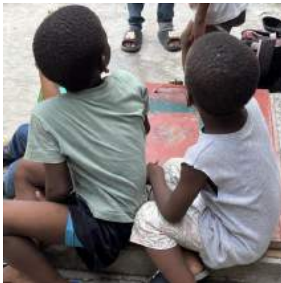
Les gangs exploitent des enfants pour accomplir différentes tâches, notamment recueillir des informations. Des milliers de personnes ont été déplacées par les violences, et de nombreux enfants risquent d'être recrutés et utilisés par les gangs.

Amnesty International s'est entretenue avec trois filles auxquelles divers gangs ont fait appel pour des corvées, notamment la cuisine et le ménage, ainsi que pour des livraisons 74 . Des membres d'un gang « me demandent d'acheter des choses pour leur petite amie et de faire le ménage chez eux... Ils me donnent seulement 250 gourdes [2 dollars américains] pour manger », a déclaré une fille de 17 ans vivant dans une zone contrôlée par le gang Ti Bwa 75 . Une fille de 17 ans vivant dans une zone contrôlée par 5 Segon a déclaré : « J'ai cuisiné tellement de fois pour eux... Parfois pour un groupe de 10 à 15 personnes... La dernière fois c'était le mois dernier... Ils m'envoient l'argent, je prépare le repas et je les appelle pour qu'ils viennent le chercher 76 . »