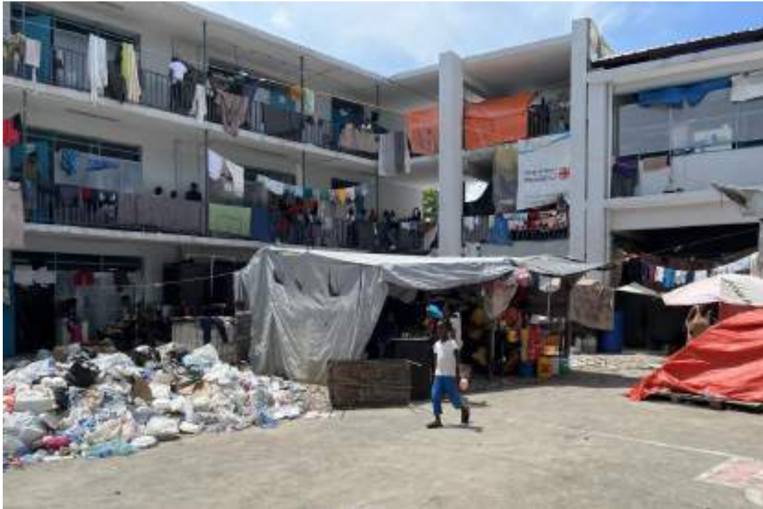
Des dizaines de milliers de personnes ont été déplacées par la violence des gangs. De nombreuses personnes se sont réfugiées dans des écoles, comme celle-ci dans la capitale Port-au-Prince.

économique plus générale, une grave crise humanitaire a éclaté dans un contexte de soutien international minime 26 . Il est estimé que 5,5 millions de personnes, soit près de la moitié de la population d'Haïti, ont besoin d'une aide humanitaire 27 .