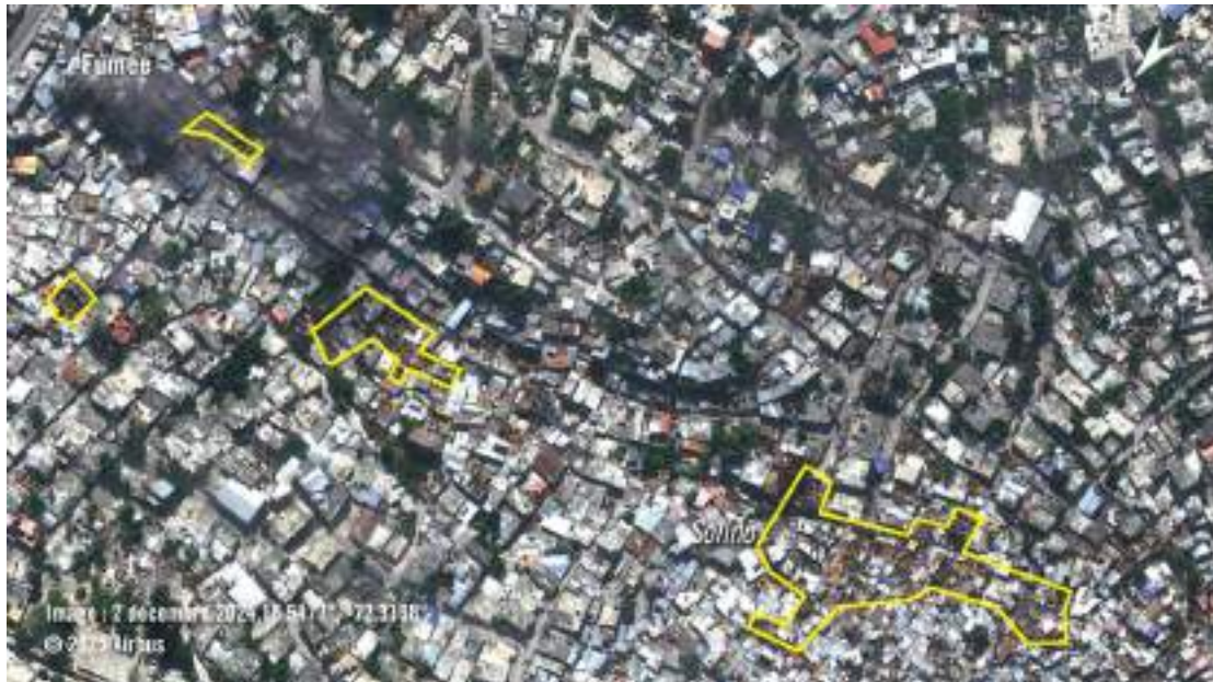
Des images satellite du 2 décembre 2024 montrent certaines des destructions ayant eu lieu dans le quartier de Solino à Port-au-Prince, une zone dans laquelle se sont déroulés des affrontements intenses entre les gangs et la police. Les marquages jaunes indiquent les zones gravement endommagées et les bâtiments détruits. Une fumée noire s'élève de l'une des zones.

Le garçon – qui a eu la jambe droite amputée au-dessus du genou – a indiqué que les tirs venaient d'une position en hauteur, connue de la population comme appartenant au gang de Brooklyn. Dans les jours qui ont suivi, le groupe a continué de terroriser les résident-e-s du quartier où vivait le garçon en tirant depuis cette zone surélevée 323 . La zone où il vivait était contrôlée par Boston depuis plusieurs années ; les deux gangs ont fini par « faire la paix » plus tard, en 2024, a indiqué le garçon 324 . Il a ajouté : « Je ne sais pas pourquoi [le tireur] m'a fait ça... Ma vie a tellement changé. Avant, j'avais beaucoup d'ami-e-s. On sortait pour traîner ensemble, mais maintenant, c'est comme si les gens ne voulaient plus être amis avec moi. On dirait qu'ils me voient différemment... Alors, je les regarde jouer sur leur téléphone et jouer dehors 325 . »