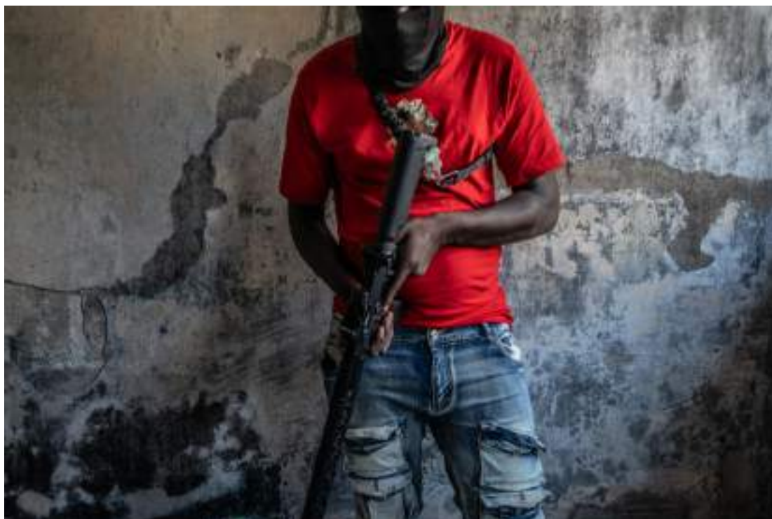
Les membres de gangs, comme celui photographié à Port-au-Prince, la capitale, le 22 février 2024, portent souvent des masques en public. Dans la plupart des cas recensés par Amnesty International, les membres de gangs portaient des masques lorsqu'ils ont violé les filles, un problème que plusieurs de ces filles ont évoqué comme les empêchant de signaler les agressions, car elles ne pouvaient pas identifier leurs agresseurs.