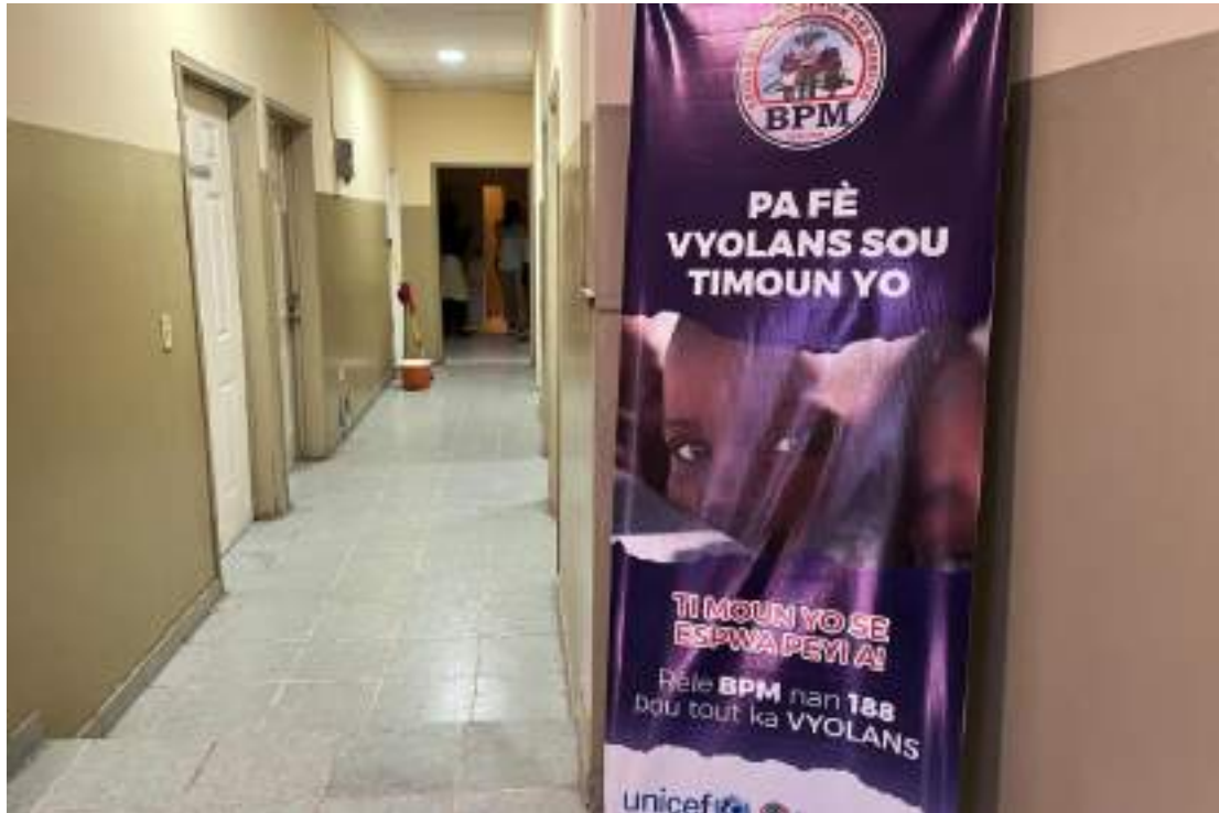
Une affiche au siège de la Brigade de protection des mineurs de la Police Nationale d'Haïti décrit les enfants comme « l'espoir du pays » et met en garde contre les violences à l'encontre des enfants.

Ces témoignages et éléments numériques mettent en lumière l'ampleur du travail nécessaire pour permettre à ces quartiers de guérir, afin qu'un processus de réinsertion puisse fonctionner. Le processus de réinsertion ne devra pas adopter une approche descendante. Les Haïtien-ne-s ont accordé peu de confiance aux gouvernements centraux successifs 135 . Des processus locaux seraient donc plus pertinents pour les populations touchées, et obtenir leur soutien doit être une priorité.