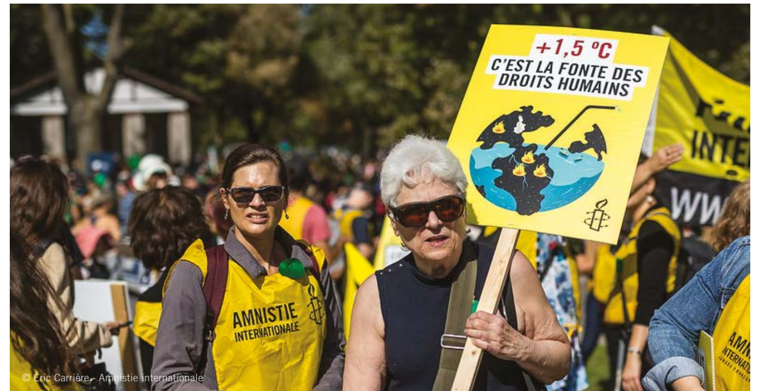
© Éric Carrière - Amnistie internationale